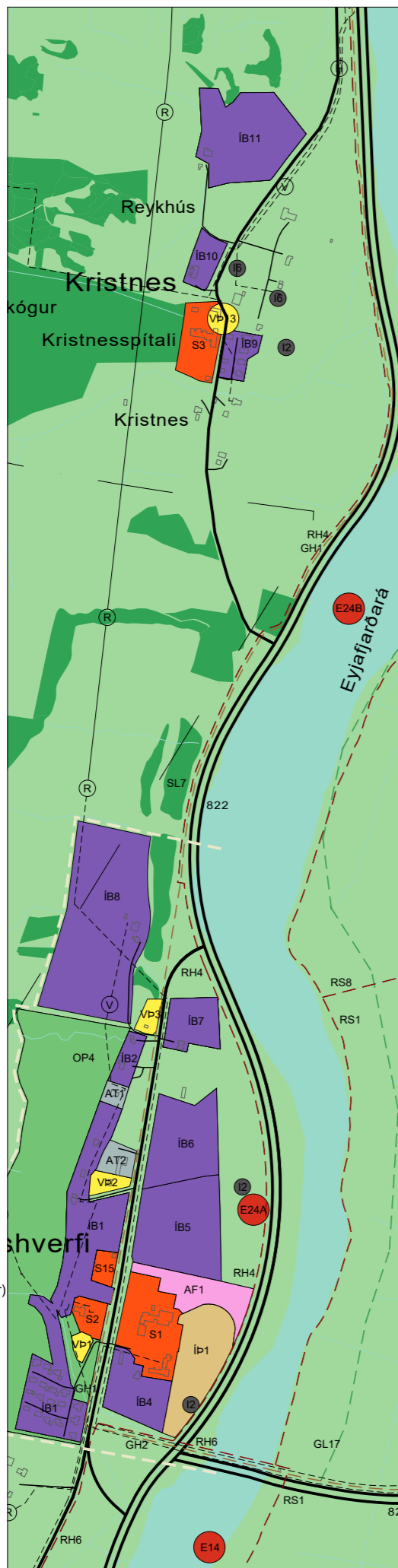
GILDANDI AÐALSKIPULAG - HRAFNAÐILSHVERFI / EYJAFJARÐARÁ SÉRUPPDRÁTTUR: NORÐURHLUTI-BYGGÐ OG BYGGÐAKJARNAR