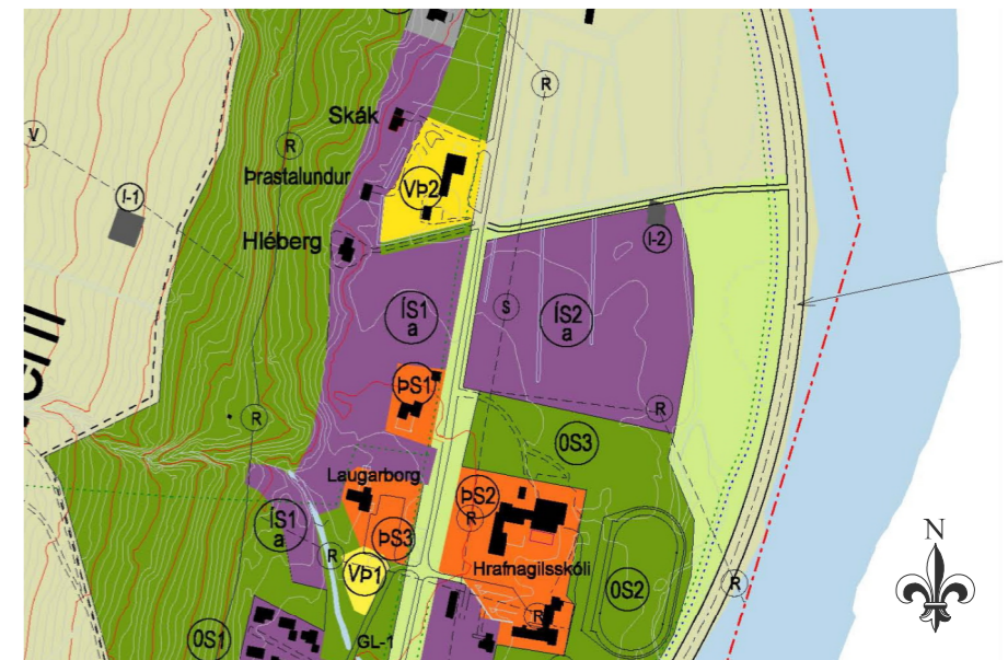
Aðalskipulag Eyjafjarðarsveitar 2005-2025

Breytingin hefur hvorki áhrif á menningarmínjar né náttúrufrar svæðisins. Fjölgun íbúða felur í sér minni háttar aukningu umferðar, sem þó verður innan eðlilegra marka miðað við byggingarmynstur svæðisins. Fjölgun íbúða bætir nýtingu svæðisins og gefur kost á fjölbreyttari íbúðagerðum en ella.