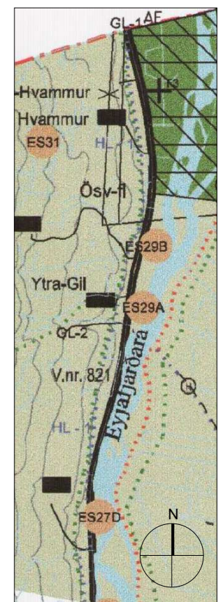
Sveitarfélagsuppráttur mkv. 1:50.000

Kortagrunnur: HNET hf, 1994. Loftmyndir: Landmælingar Íslands. Njón myndir: Ísgraf hf - notaðar til viðmiðunar