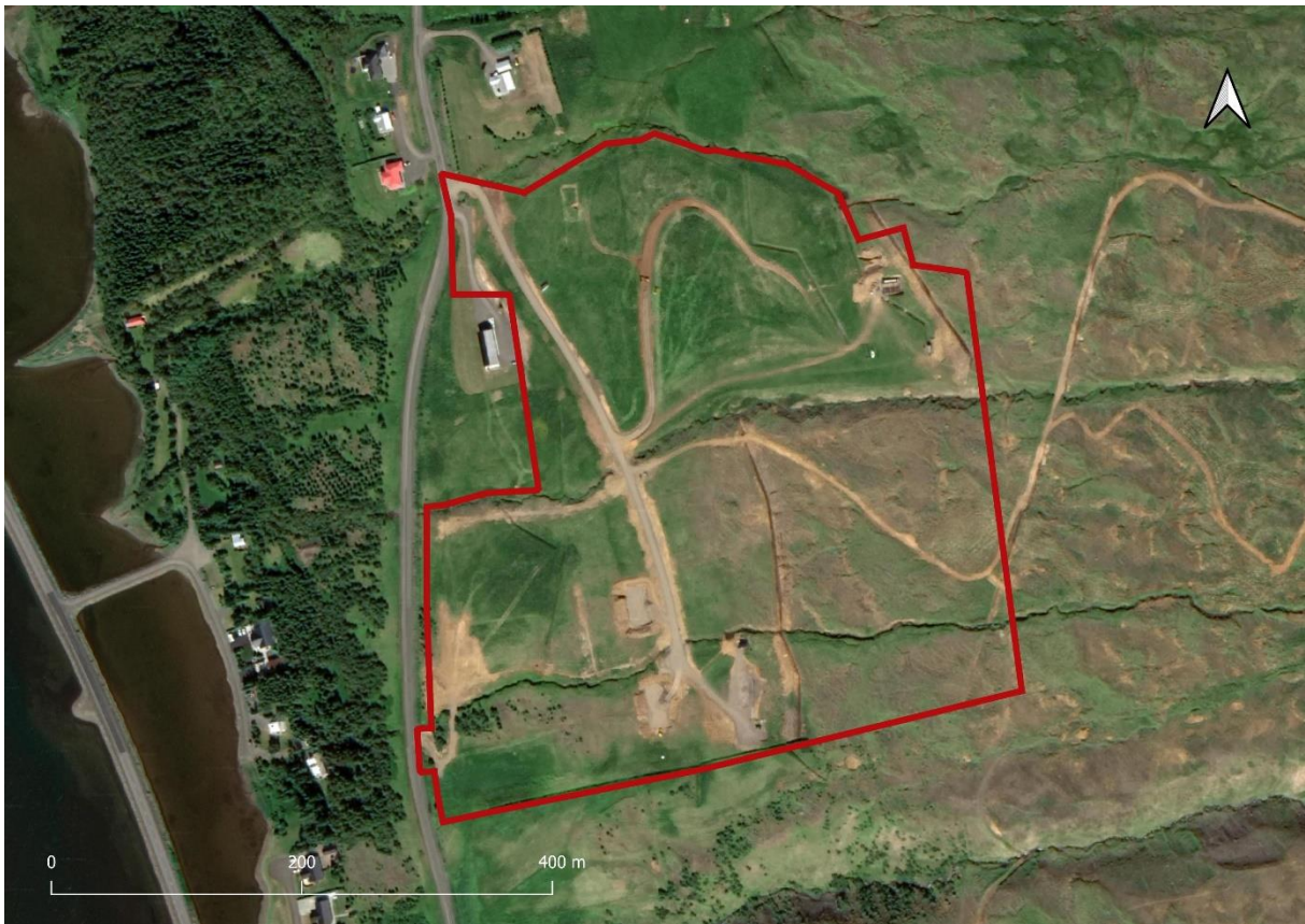
5. mynd. Skipulagssvæðið.