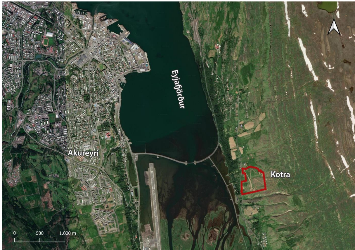
1. mynd. Staðsetning Kotru í Eyjafirði.

Kotra er íbúðarsvæði úr landi Syðri-Varðgjár, Eyjafjarðarsveit. Á fyrri hluta árs 2018 var jörðinni skipt og fékk syðri hluti hennar heitið Kotra (landnr. 226737).