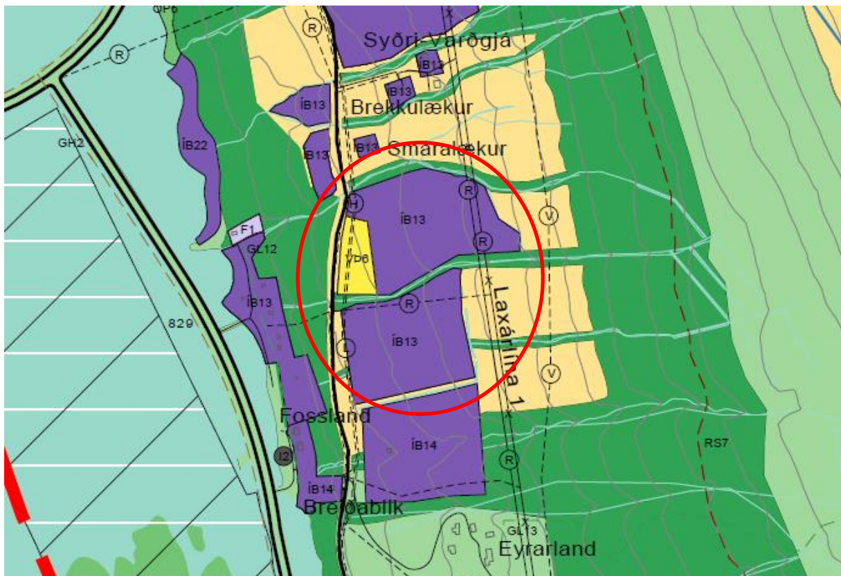
7. mynd. Klippa úr aðalskipulagsuppdraetti Eyjafjarðarsveitar 2018-2030. Skipulagssvæðið er merkt með rauðum hring.

Almenn ákvæði gilda um íbúðarsvæði í Eyjafjarðarsveit. Eftirtalin atriði eiga við svæði ÍB13: