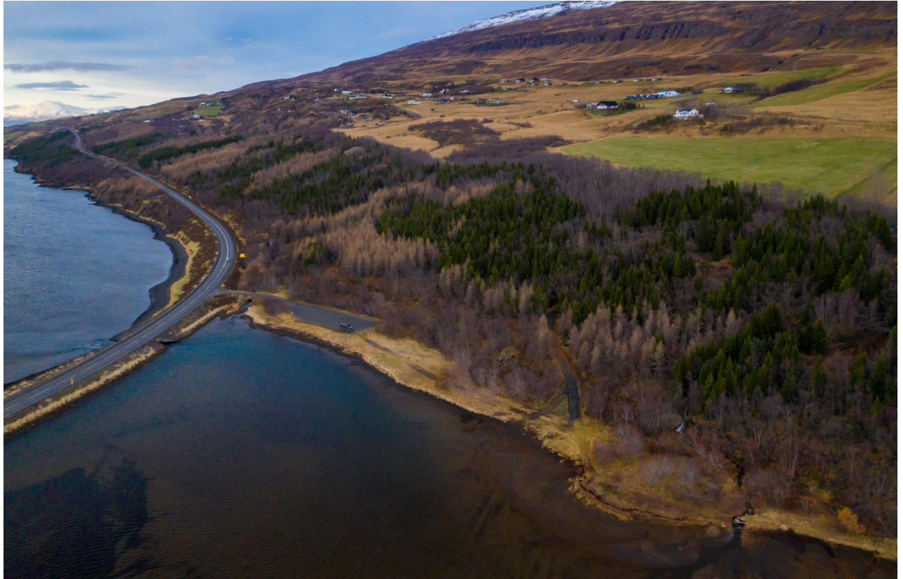
Mynd 2. Yfirlitsmynd yfir skipulagssvæðið úr suðri.