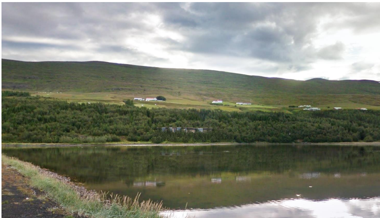
Mynd 5. Yfirlitsmynd úr vestri þar sem sjá má hvernig baðhúsið liggur í landi (útlit húss er ekki bindandi).

Baðstaðurinn verður staðsettur um 25 m frá standlínu lónsins, inni í þéttum skóginum og því hefur baðstaðurinn ekki áhrif á aðgengi almennings meðfram fjörunni, um flatann ofan fjörunnar eða um núverandi stíga sem liggja um skóginn. Sótt verður um undanþágu frá 50 m fjarlægðarmörkum mannvirkja frá standlínu skv. gr. 5.3.2.14 skipulagsreglugerðar nr. 90/2013 eins og mögulegt er skv. 12. mgr. 45 gr. skipulagslaga nr. 123/2010.