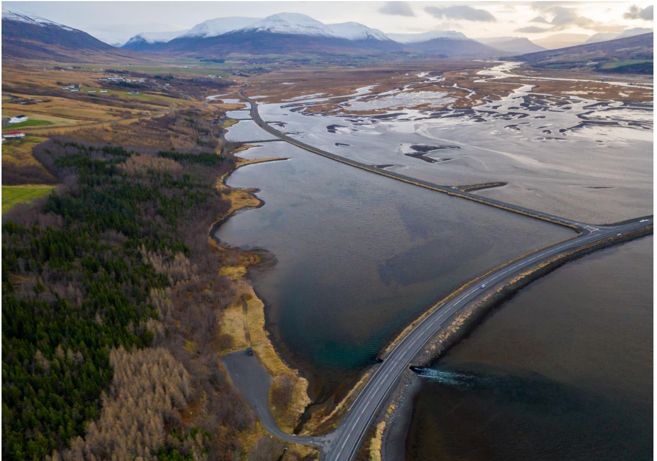
Mynd 6. Yfirlitsmynd yfir skipulagssvæðið og inn Eyjafjörð úr norðri.

Staðsetning innan byggingarreits er frjáls.