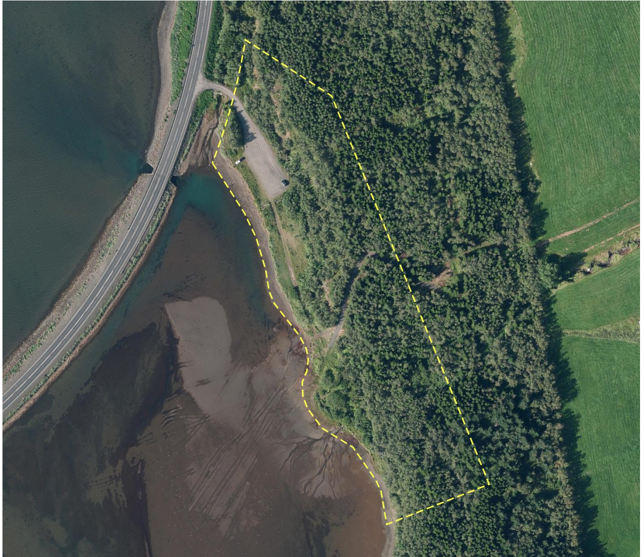
Mynd 1. Skipulagssvæði deiliskipulagsins er afmarkað með gulri línu.