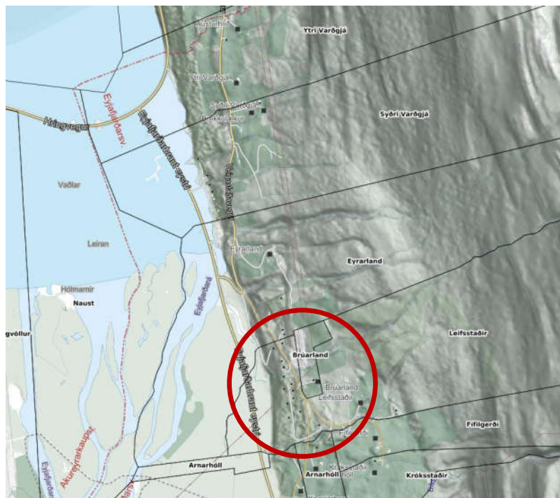
Mynd 1.0: Yfirlitskort af svæðinu. Deiliskipulagssvæðið merkt með rauðum hring. www.map.is

Skipulagsbreyting þessi er unnin eftir hnitsettum kortagrunni sem mældur er með drónamælingu af Verkfræðistofunni Eflu í október 2021.