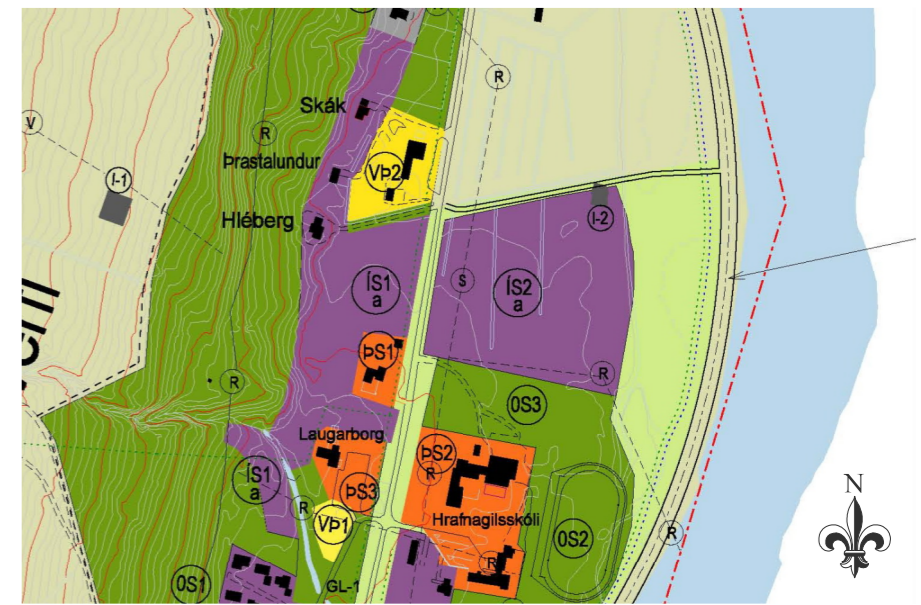
Aðalskipulag Eyjafjarðarsveitar 2005-2025

Breytingin hefur hvorki áhrif á menningarmínjar né náttúrufrar svæðisins. Fjölgun íbúða felur í sér minni háttar aukningu umferðar, sem þó verður innan eðlilegra marka miðað við byggingarmynstur svæðisins. Fjölgun íbúða bætir nýtingu svæðisins og gefur kost á fjölbreyttari íbúðagerðum en ella.