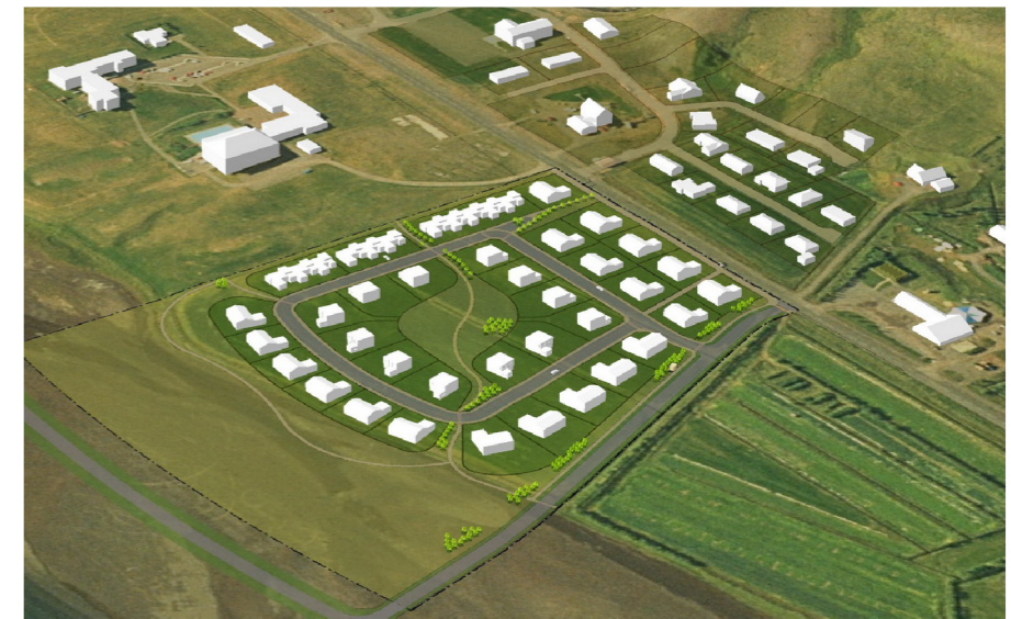
Einfalt landlíkan sem sýnir breytt skipulag

SAMÞYKKT Deiliskipulagsbreyting þessi sem auglýst hefur verið skv. 41. gr. skipulagslaga nr 123/2010 var samþykkt í sveitarstjórn Eyjafjarðarsveitar